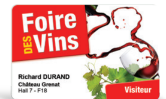
Invitations à vos événements