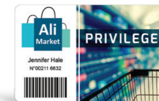
Cartes de fidélité